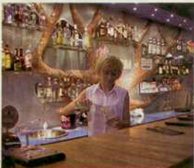
■ Klub „Imperium” poleca swoją specjalność - drinka „Imperium”.