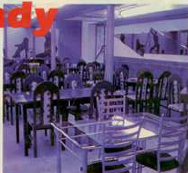
■ Klub ma także część restauracyjną.

Do wygrania 10 podwójnych zaproszeń do klubu „Imperium”, do wykorzystania w najbliższy piątek lub sobotę. Wystarczy zadzwonić pod redakcyjny numer w Radomiu, dzisiaj o godzinie 10, tel. (0-48) 36-35-356.