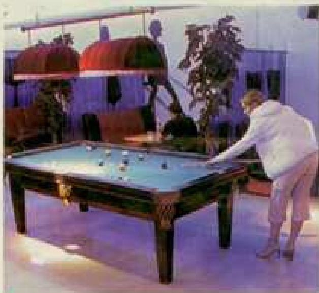
■ Stół do bilarda oświetlają stylowe, aksamitne lampy.